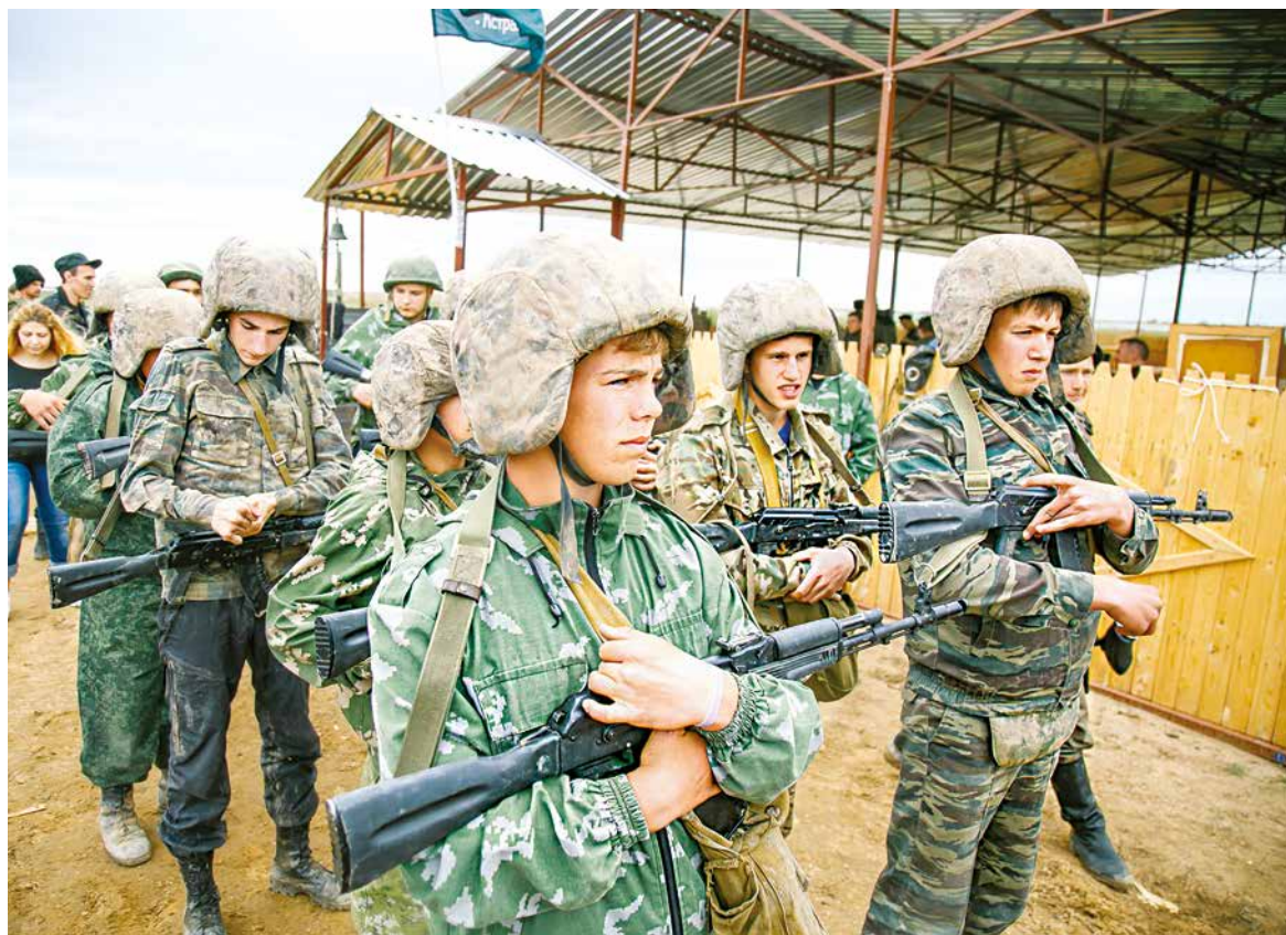
Военно-полевой выход «Георгий Победоносец-2016».

После активной программы все участники собрались у костра за полевым обедом, пообщались, поделились впечатлениями. Этот полевой выход стал первым в череде подготовительных мероприятий к межрегиональному военно-спортивному лагерю «Георгий Победоносец-2017», который пройдет в мае этого года.