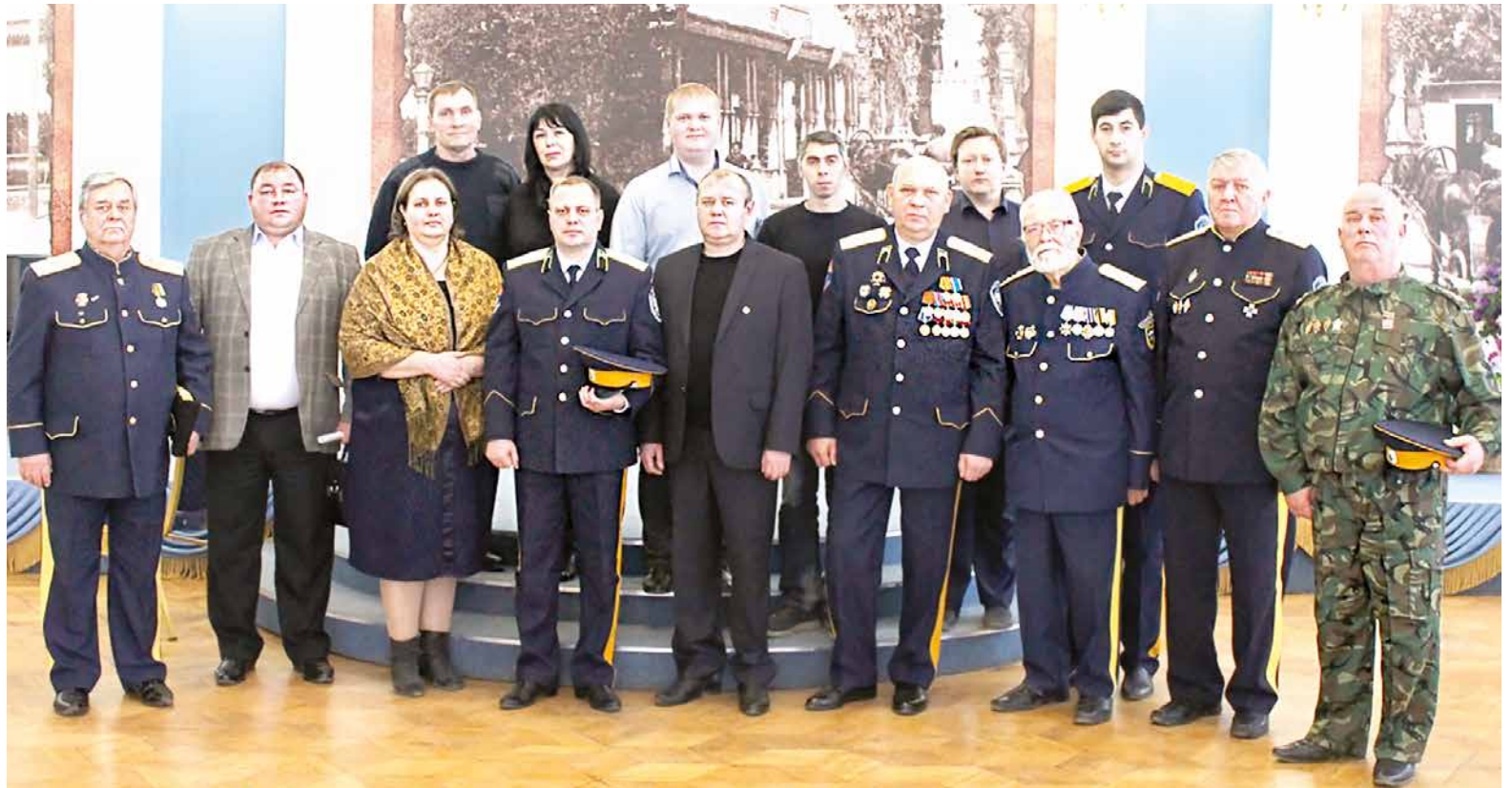
Участники круглого стола.

В ходе дискуссии участниками круглого стола было отмечено, что действительно имеются проблемы по поиску первоисточников, поскольку, занимаясь этой тематикой, приходится обращаться в государственные и ведомственные архивы не только нашей области, но и Москвы, Санкт-Петербурга, Саратова, Ростова-на-Дону и других городов. Необходимо на-